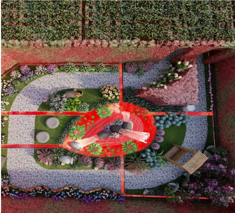
Imagen del "jardín de Baco" abajo.