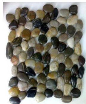
Lámina de polietileno de 0,5 mm de espesor para la base del estanque. Los márgenes del estanque se encuentran conformados por chinos de color blanco y negro.